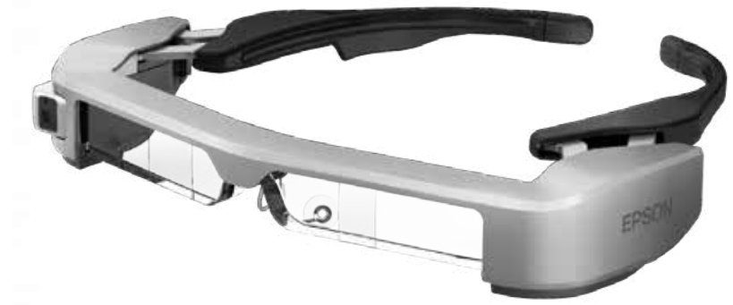
Moverio BTR350 Epson