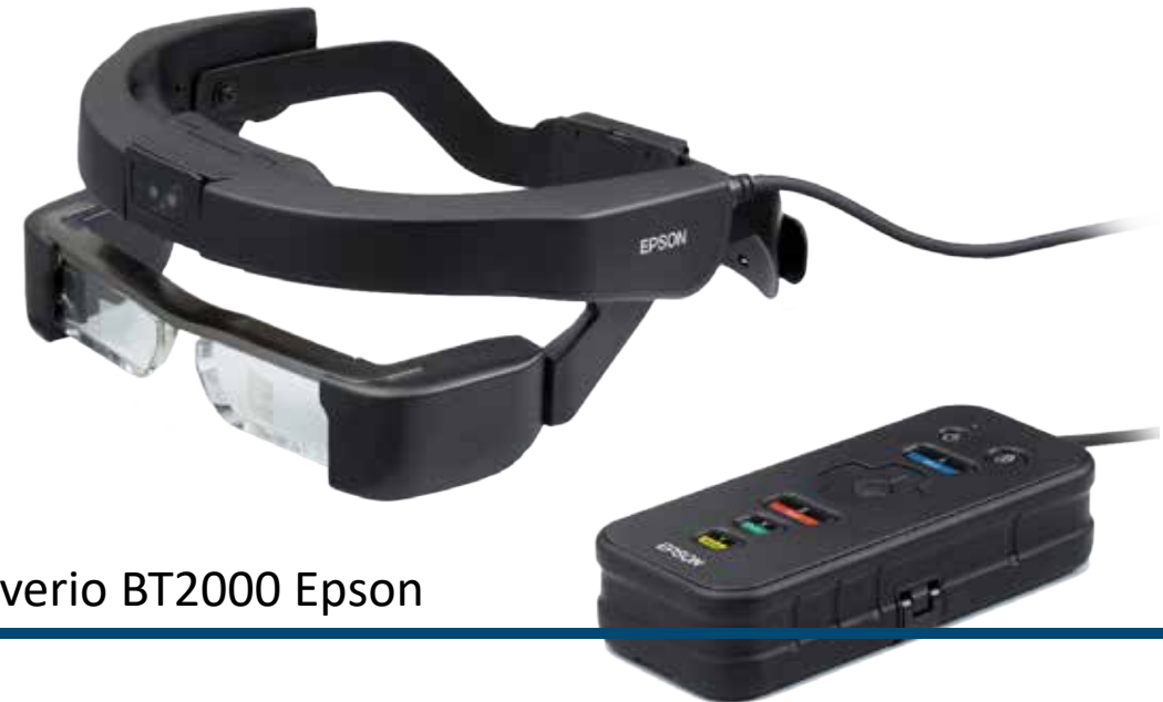
Moverio BT2000 Epson